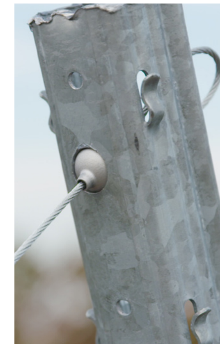
GPAK PLUS M: 金属製の柱で利用