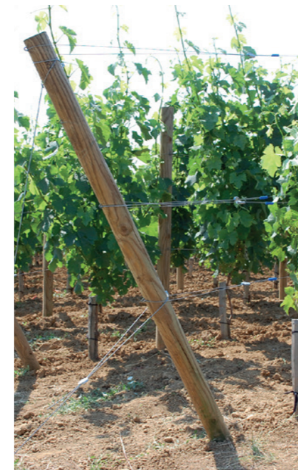
GPAK CLASSIC: 木製柱のチョーク結び付のループ形状部で利用