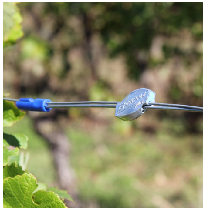
グリップルプラスミディアム - 端末ワイヤをツイスターで保護します。