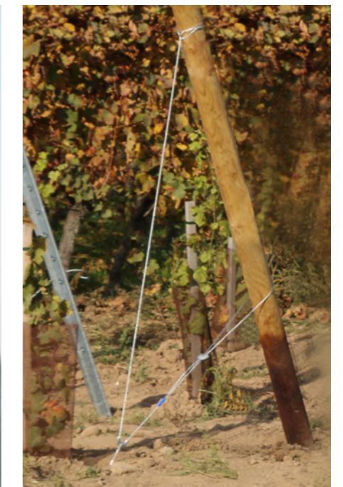
GPAK PLUS W: 木製の柱で利用