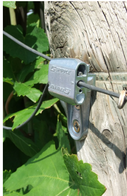
VIT-Sキット: 木製の隅柱で利用