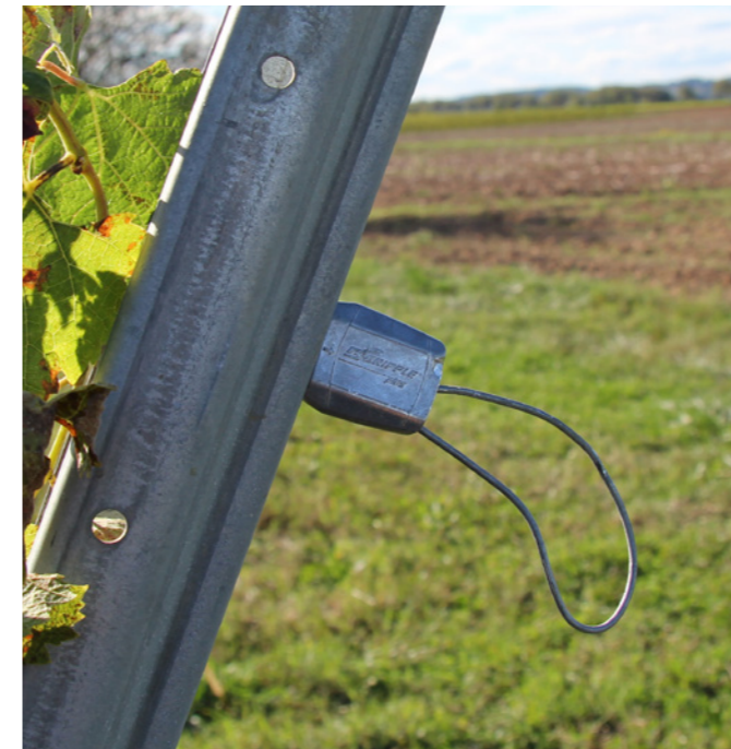
グリップルプラス No.1 - 金属製隅柱用