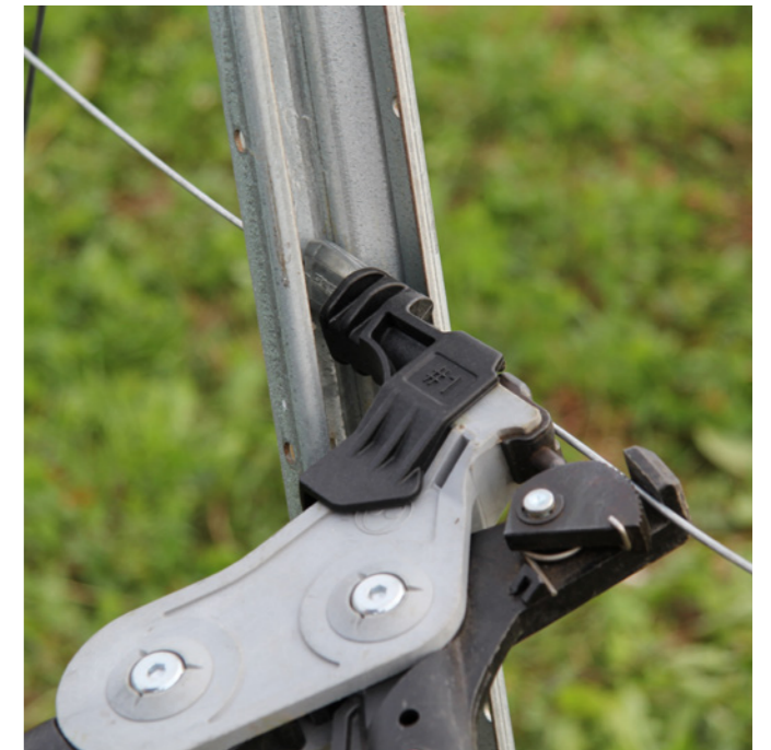
アダプター: 隅柱の内側でワイヤの張り工具を利用する時に利用します。