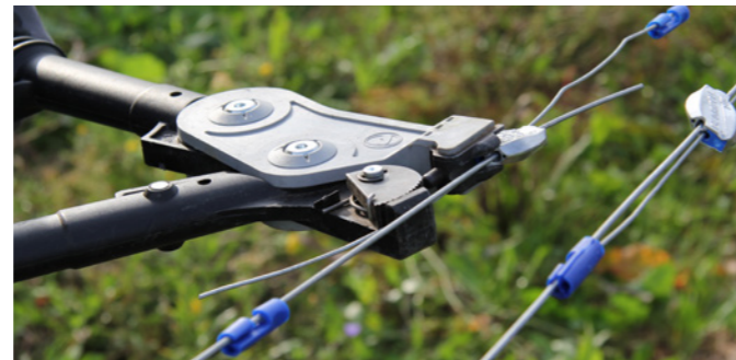
上側: グリップルプラスミディアム利用のワイヤ改修作業。 下側: ジャンボ利用の標準的なワイヤ接続作業。