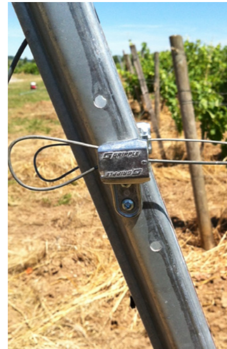
VIT-Sキット: 金属製の隅柱で利用