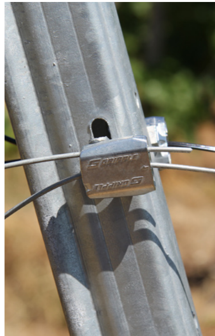
VIT-S: 金属製の隅柱で利用