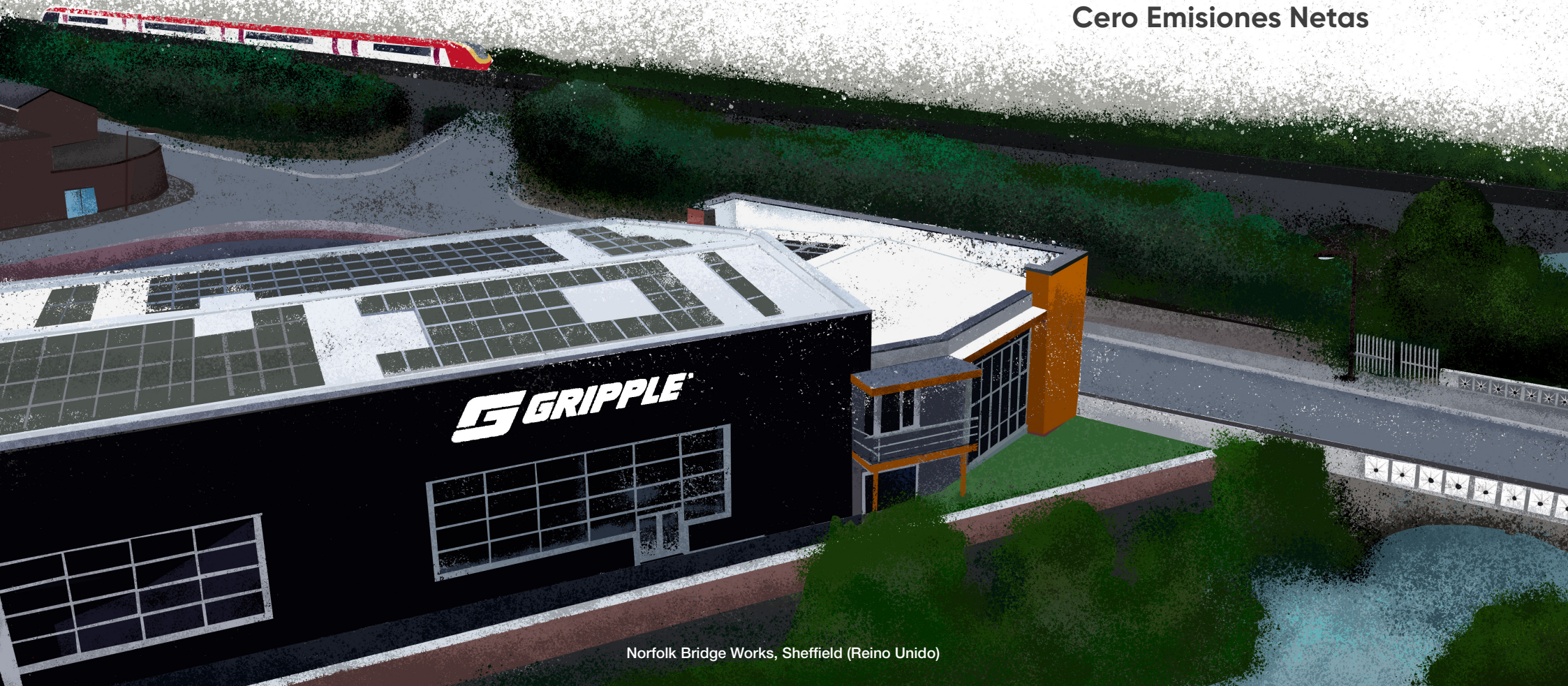
Norfolk Bridge Works, Sheffield (Reino Unido)