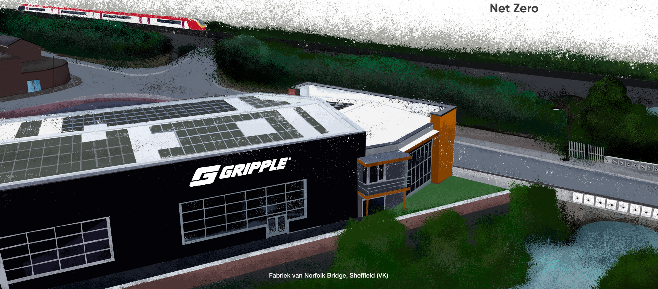
Fabriek van Norfolk Bridge, Sheffield (VK)